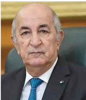
l'intérêt des deux peuples frères", lit-on dans le communiqué.