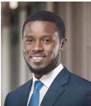
l'Algérie à renforcer les liens d'amitié et à promouvoir la coopération bilatérale, dans

"Le président de la République, M. Abdelmadjid Tebboune, a félicité, ce jour, le président élu du Sénégal, Bassirou Diomaye Faye, lui exprimant, au nom du peuple et du gouvernement algériens, ses sincères vœux de réussite dans l'accomplissement de sa noble mission, tout en réaffirmant la disposition de