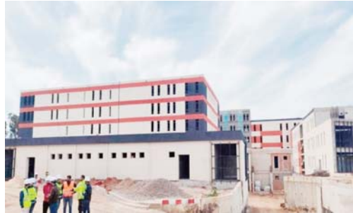
ajoutant que «le directeur de la prise en charge de la santé des malades, des médicaments et du per-

pital de 60 lits, dans la commune de Mendès, où il a critiqué les délais de réalisation de cette structure les jugeant trop longs, insistant sur la nécessité de «confier, à l'avenir, les projets de réalisation des établissements sanitaires et des structures relevant du secteur de la santé au ministère de l'Habitat, de l'Urbanisme et de la Ville, afin d'accélérer le rythme de leur réalisation et leur livraison dans les délais impartis». Il a souligné que «le transfert de la réalisation des structures et établissements sanitaires au secteur de l'habitat est du à l'expérience et la qualification qu'il possède pour concrétiser des projets selon les critères et les délais impartis»,