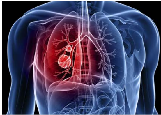
TABAGISME PASSIF ET POLLUTION