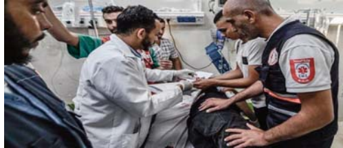
Ghaza, a été arrêté en décembre 2023, alors qu'il se trouvait à l'hôpital Al-Awda (nord) aux côtés d'un