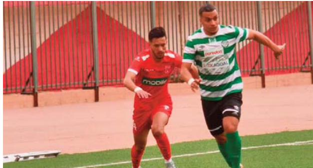
12e place avec 28 points, soit une unité de

Dans ce duel au sommet dans la course à l'accession, les joueurs du RCK qui surfent sur une série de six matchs sans défaites (5 victoires, 1 nul), auront à cœur de faire chuter les gars de Mostaganem, vainqueurs le week-end dernier contre le WA Boufarik (1-0). En cas de succès, le Raed reviendrait à deux points de l'ESM et ainsi relancer complètement la course à l'accession à quatre journées de la fin de saison. Pour leur part, les joueurs de l'Espérance tenteront de revenir avec un résultat positif qui leur permettrait de creuser l'écart en tête du classement et confirmer leur statut de solide candidat à l'accession en ligue 1. Cette 26e journée sera également marquée par plusieurs duels dans la lutte pour le maintien, à commencer par l'opposition entre le WA Boufarik et NA Hussein-Dey, qui occupent conjointement la