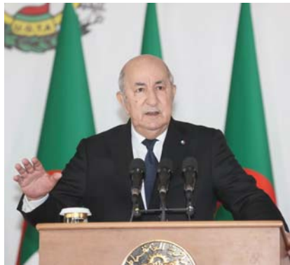
mis qui n'ont eu de cesse de tenter d'avoir raison de son unité et de sa force..leur filiation continue, à ce jour, de cibler notre pays". Le Président de la République a pour-

Dans son message, le président de la République a souligné que "l'intérêt de l'Etat pour la question de la mémoire repose sur l'appréciation de la responsabilité nationale dans la préservation de legs glorieux des générations et découle de la fierté de la nation de son passé honorable.. mais aussi des immenses sacrifices du peuple dans l'histoire ancienne et moderne de l'Algérie, en vue de repousser les convoitises et barrer la route aux enne-