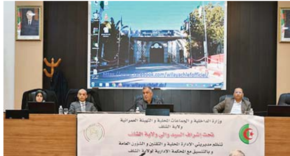
Dans le même sillage, l'administration du Musée national public "Abdelmajid Meziane" organise des journées de sensibilisation sur la lutte contre l'atteinte au patrimoine culturel au profit des partenaires des corps de sécurité.

Cette session de formation sera assurée par des encadreurs de différentes entreprises relevant du secteur, et axée sur des notions sur le patrimoine, les mécanismes de préservation du patrimoine, le rôle de la commune dans la protection du patrimoine, notamment les sites archéologiques et historiques, ainsi que les modalités et voies de gestion des associations et des festivals.