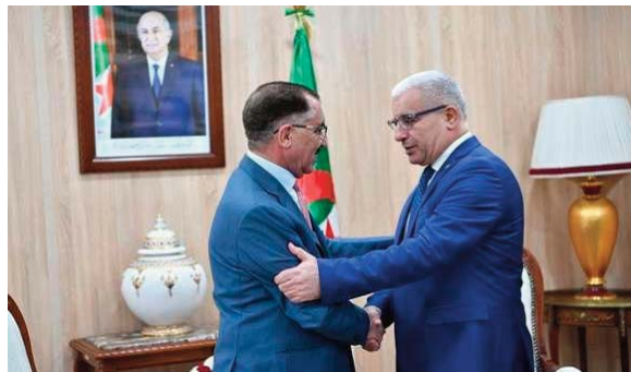
entamé, dimanche, une visite en Algérie, qui s'inscrit dans le cadre des préparatifs en cours, en vue de la tenue de la prochaine conférence de l'UIPA.

Le SG de l'UIPA, par ailleurs, salué "la position de l'Algérie sur ce qui se déroule en Palestine occupée de manière générale et dans la bande de Gaza en particulier, comme génocide méthodique perpétré par l'entité sioniste à l'encontre des Palestiniens parmi les enfants et les femmes". M. Al-Chawabka a, en outre, souligné que l'Algérie "apporte le plus grand soutien à la cause palestinienne et nul ne pourrait nier son rôle, d'autant qu'elle a été à l'avant-garde dans l'adoption des positions de soutien aux causes justes" dans le monde. Le SG de l'UIPA a