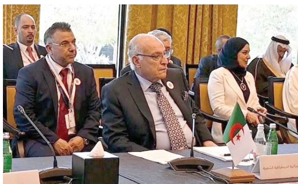
du Sommet de Manama.

Par ailleurs, M. Ahmed Attaf a eu, en marge de ces travaux, des entretiens bilatéraux avec le vice-Premier ministre et ministre des Affaires étrangères et des Expatriés jordaniens, M. Ayman Safadi, avec qui il a évoqué des questions concernant les relations algéro-jordaniennes en sus de la coordination bilatérale en prévision