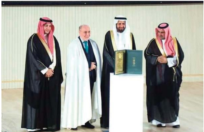
Il a également affirmé que la mission redoublera d'efforts pour la prochaine saison et ce "dès aujourd'hui inchaallah".

"Nous sommes, grâce à Dieu, parmi les meilleures délégations notamment dans la catégorie pour laquelle nous avons décroché ce prix. Toutes nos félicitations à nos frères qui ont contribué à cet exploit et pour ces efforts bénis ainsi qu'à tous les secteurs ayant participé à la préparation de l'opération du Hadj et à tous les membres de la mission du Bureau des affaires des pèlerins algériens. Félicitations à tous et à davantage de succès et de réussite inchaallah", ajoute le ministre.