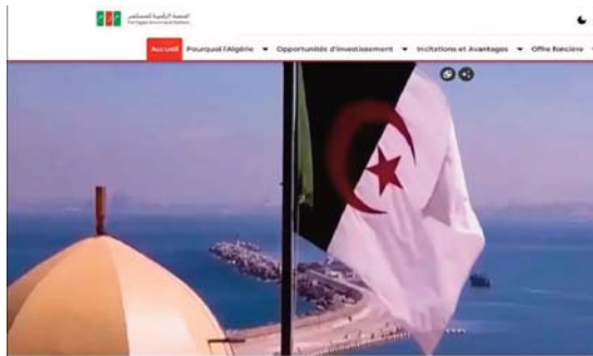
Bienvenue Sur La Plateforme Numérique De L'investi

Le lancement de cette plateforme représente une nouvelle