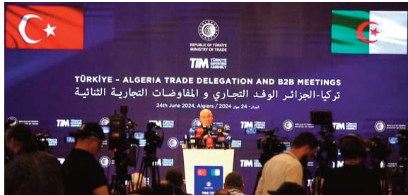
Alger. Une délégation turque importante d'hommes d'affaires et de chefs d'entreprises conduite par le vice-président de la République de Turquie, M. Cevdet Yulmaz, est arrivée à Alger dimanche dans le cadre de cette participation.

Ce rendez-vous économique vise à donner une nouvelle impulsion au partenariat économique algéro-turc et à explorer les opportunités d'affaires et d'investissement entre les deux pays. Lors de ce forum, des rencontres d'affaires "B to B" sont prévues entre les chefs d'entreprises algériennes et turques actives dans divers domaines, notamment l'industrie, l'énergie, les mines, les énergies renouvelables, les travaux publics et infrastructures de base. La Turquie est l'invitée d'honneur de la 55ème édition de la Foire internationale d'Alger (FIA), qui s'ouvre ce lundi au Palais des expositions à