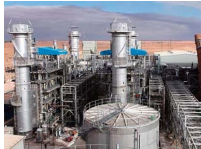
La mise en service partielle de la plus grande centrale électrique en Algérie, à Mostaganem, ce qui permettra de renforcer les capacités nationale de production de 450 Mégawatts, dans une première étape.

Cette station s'inscrit dans le cadre de la mise en œuvre du programme de développement de la wilaya de Mostaganem, du renforcement de l'approvisionnement du réseau national en énergie électrique et de l'amélioration du service public, particulièrement, dans cette wilaya côtière à caractère touristique et industriel et dans toutes les wilayas du pays, a ajouté le groupe public.