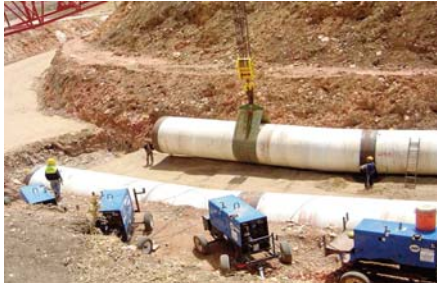
(commune de Belarbi).

Les travaux de réalisation de transfert d'eau vers les zones Nord de la wilaya de Sidi Bel-Abbes sont également en cours, de même que ceux de réalisation d'un réservoir d'eau de 1000 mètres au douar El Gouassem