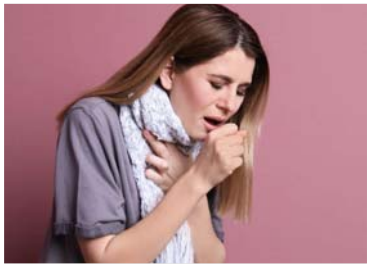
perturbe le sommeil.

La toux est le troisième motif le plus fréquent de consultation. Elle peut avoir différentes causes et son traitement dépend de son origine.