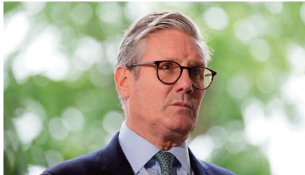
Reeves a récemment prévenu que le nouveau gouvernement devrait prendre des "décisions difficiles" - réduction des dépenses ou augmentation des impôts - pour son premier budget qu'elle doit présenter le 30 octobre.