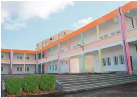
a indiqué la wali dans son intervention à l'occasion. Elle a souligné le renforcement du secteur éducatif

Cette opération s'inscrit dans le cadre d'un important programme de développement prévoyant la réception de 42 groupes scolaires du cycle primaire, à la fin de l'année en cours,