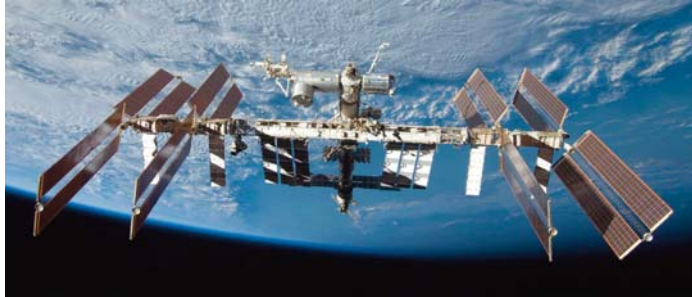
2023, doivent revenir sur terre à bord de l'astronef Soyouz MS-25 le 23 septembre 2024, après un séjour record de 364 jours dans l'espace.

MM. Kononenko et Tchoub ont battu le précédent record du plus long séjour continu dans l'espace dans la cadre du programme ISS, record qui était détenu par les cosmonautes Sergueï Prokopiev et Dimitri Petelin, et par l'astronaute de la NASA Francisco Rubio. Ces trois hommes avaient établi le précédent record en septembre 2023, en passant 370 jours, 21 heures, 22 minutes et 16 secondes à bord de l'ISS. MM. Kononenko et Tchoub, qui ont décollé pour l'ISS le 15 septembre