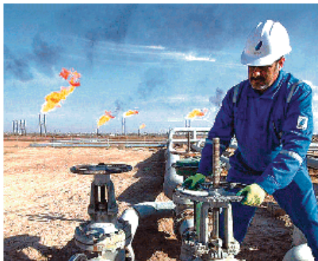
selon lesquelles la Libye "pourrait restaurer des exportations de brut" mardi. Par ailleurs, les perspec-

Les cours sont à l'inverse plombés par des informations de la presse financière