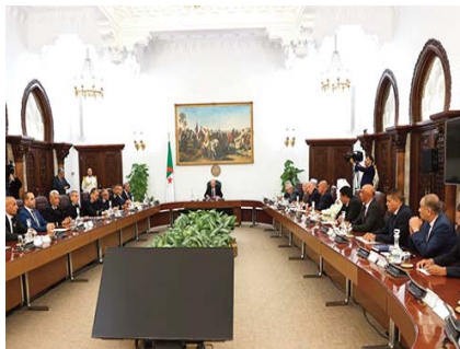
de la Présidence de la République, en tant que vice-président de la Commission,