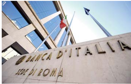
Sur les six premiers mois de l'année, le déficit public a atteint 5,8% du PIB contre 7,9% au cours de la même période en 2023. Le gouvernement italien a

Le solde budgétaire primaire (avant charge de la dette) est redevenu positif pour la première fois depuis le quatrième trimestre 2019, souligne l'Istat, à 1,1% du PIB contre -0,8% un an plus tôt.