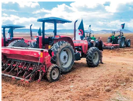
la wilaya, a-t-il ajouté. Pour la concrétisation des objectifs de cette campagne labours-semailles, une

Ces superficies seront étendues à 3.300 autres hectares dans les zones d'épandage, et ce à la faveur des pluies qui s'abattent régulièrement sur la région depuis le début du mois de septembre et aussi du remplissage des puits et autres retenues collinaires à travers plusieurs localités de