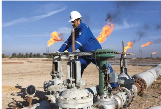
due, essentiellement, aux prévisions de demande plus faibles et au ralentissement de la croissance économique en Chine, selon les analystes.

Le marché suit attentivement les développements de la situation au Moyen-Orient et leurs conséquences sur l'approvisionnement en pétrole, indiquent des analystes. Le prix de l'or noir reste ainsi lundi largement inférieur au niveau atteint au début du mois en cours. Le cours du baril de Brent s'était alors hissé au-dessus de 80 dollars. Structurellement, la baisse des prix est